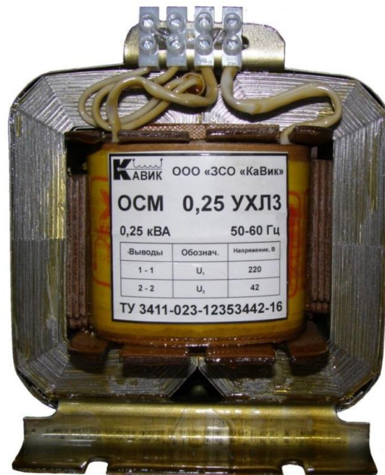
Рис. 1 Общий вид трансформатора.

1.9. Трансформаторы предназначены для монтажа в аппарате (устройстве), у которого защита от прикосновения, попадания воды и перегрузки осуществляется этим аппаратом (устройством).